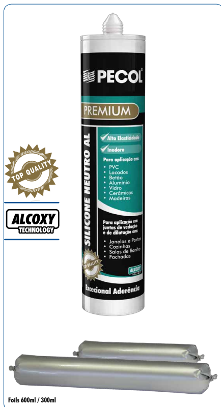
Foils 600ml / 300ml