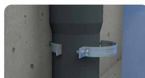
5. Coloque o tubo e aperte a abraçadeira