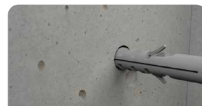
3. Introduza a bucha