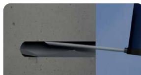
2. Limpe o furo