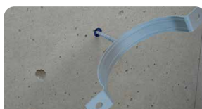
4. Insira a abraçadeira na bucha previamente instalada