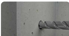
1. Fure o Substrato