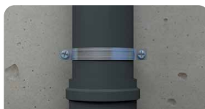
7. Abraçadeira está instalada